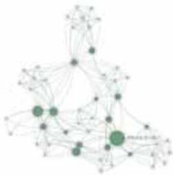
图3 发展型资助关键词共现网络分析图谱