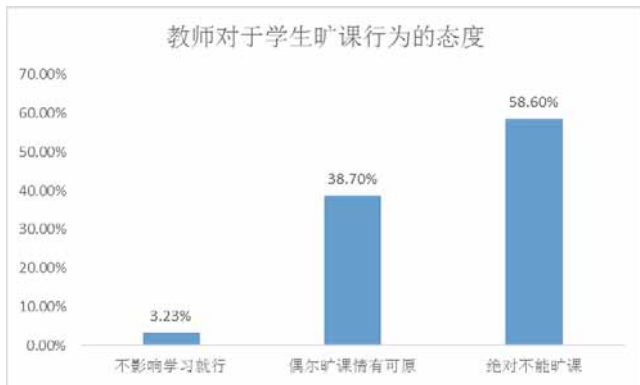
图2 教师对于学生旷课行为的态度

调查发现,学生的出勤率为70%~100%。教师对于学生旷课行为的态度调查一项中(见图2),58.06%教师认为学生应以学业为重,绝对不能旷课,38.7%的教师认为学生如果有重要的事情,偶尔旷课也是情有可原,3.23%的教师认为学生旷课与否并不重要,不影响学习就行;教师对于学生早退行为的处理一项的调查中,54.8%教师会重新点名,找出早退的同学,严肃批评,45.16%的教师会叫学委把早退的学生姓名下课报上,不占用课堂时间。