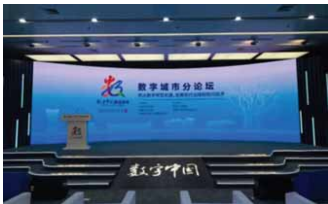
图2 2020第三届数字中国建设峰会